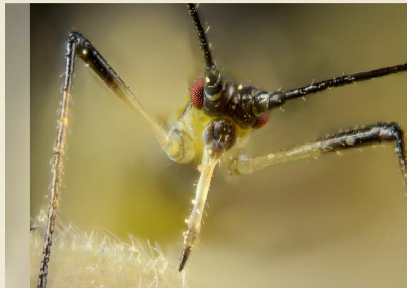
Macrosiphum rosae (rose aphid).