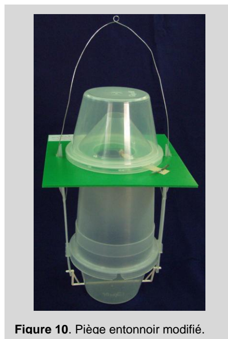
Figure 10. Piège entonnoir modifié.