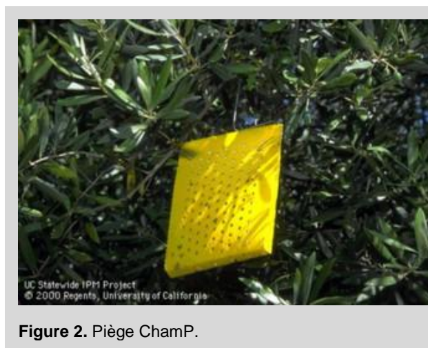
Figure 2. Piège ChamP.