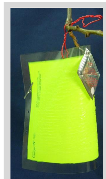
Figure 4. Piège gluant « en cape » jaune fluorescent.

Pendant de nombreuses années, ce piège a été utilisé dans des programmes d'exclusion, de suppression ou d'éradication avec des objectifs multiples, comprenant des études d'écologie des populations (abondance saisonnière, répartition, séquence des hôtes, etc.); le piégeage de repérage et de délimitation; et la prospection des populations de mouches des fruits stériles dans les zones faisant l'objet de lâchers en masse de mouches stériles. Les pièges JT/Delta peuvent ne pas être adaptés à certaines conditions environnementales (par exemple, pluie ou poussière).