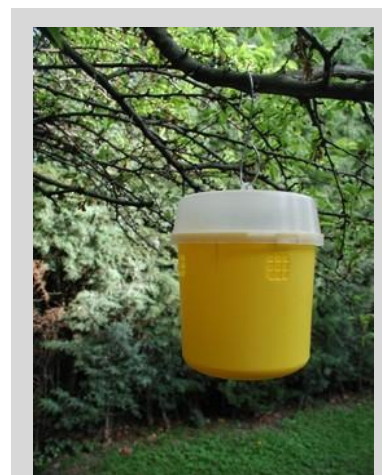
Figure 18. Piège Tephri.