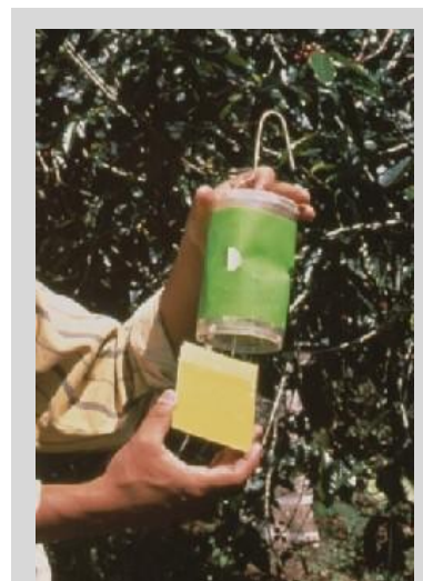
Figure 12. Piège sec à fond ouvert (Phase IV).

Ce piège est une sphère rouge d'un diamètre de 8 cm (Figure 13). Le piège imite la taille et la forme d'une pomme mûre. Une version verte est aussi utilisée. Le piège est recouvert d'un matériau gluant et est appâté avec une odeur synthétique de fruit, le butyle hexanoate, qui a un parfum semblable à celui d'un fruit mûr. Un crochet en fil de fer est fixé en haut de la sphère pour suspendre le piège aux branches des arbres.