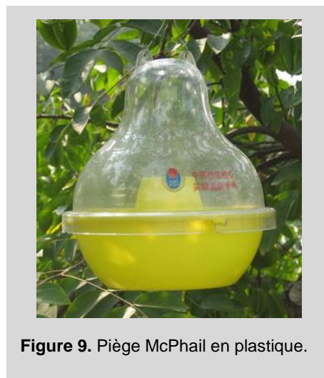
Figure 9. Piège McPhail en plastique.

Pour appâter avec des pastilles de levure, mélanger trois à cinq pastilles de torula dans 500 ml d'eau ou suivre les recommandations du fabricant. Agiter pour dissoudre les pastilles. Pour appâter avec un hydrolysate de protéines, mélanger l'hydrolysate et le borax (s'il n'a pas déjà été ajouté aux protéines) dans de l'eau jusqu'à obtention d'une concentration de 5 à 9 pour cent de protéines hydrolysées et de 3 pour cent de borax.