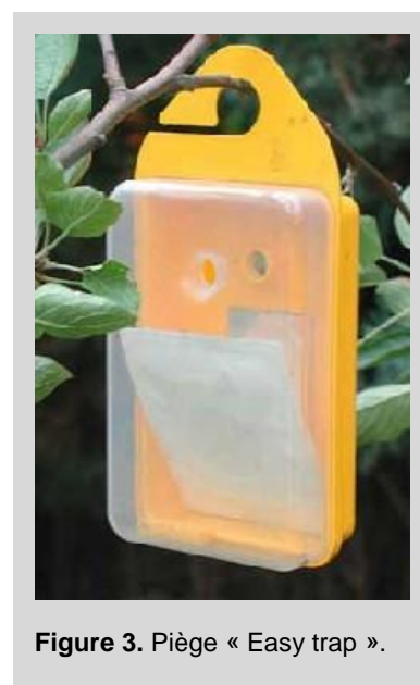
Figure 3. Piège « Easy trap ».