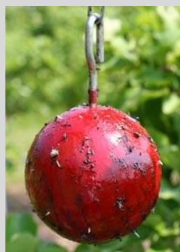
Figure 13. Piège sphérique rouge.