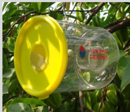
Figure 16. Variante du piège Steiner.