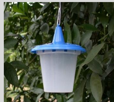
Figure 14. Piège Sensus.

Le piège Steiner est un cylindre horizontal en plastique transparent, avec une ouverture à chaque extrémité. Le piège Steiner classique a une longueur de 14,5 cm et un diamètre de 11 cm (Figure 15). Il en existe plusieurs versions, dont certaines ont une longueur de 12 cm et un diamètre de 10 cm (Figure 16) ou une longueur de 14 cm et un diamètre de 8,5 cm (Figure 17). Un crochet en fil de fer, placé en haut du corps du piège, est utilisé pour le suspendre aux branches des arbres.