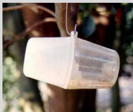
Figure 17. Variante du piège Steiner.