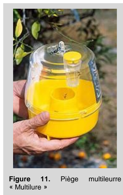
Figure 11. Piège multileurre « Multilure »

Ce piège fonctionne selon le même principe que le piège McPhail. Toutefois, un piège MLT utilisé avec un attractif synthétique sec est plus efficace et sélectif qu'un piège MLT ou McPhail utilisé avec un attractif protéique liquide. Une autre différence importante est qu'un piège MLT appâté avec un attractif synthétique sec peut être maintenu plus propre et nécessite une main d'œuvre bien moins importante qu'un piège McPhail. Lorsque des attractifs alimentaires synthétiques sont utilisés, des diffuseurs sont attachés aux parois internes de la portion cylindrique supérieure du piège ou bien ils sont accrochés grâce à une pince placée en haut. Pour un fonctionnement correct du piège, il est essentiel que la partie supérieure reste transparente.