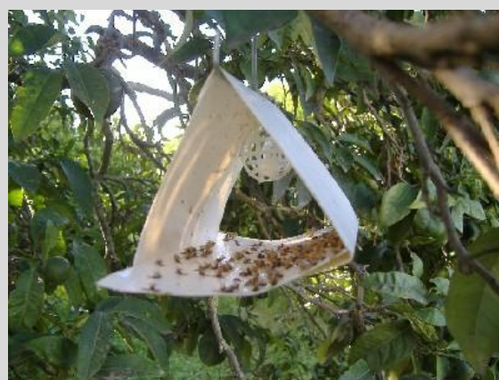
Figure 5. Piège Jackson ou piège Delta.