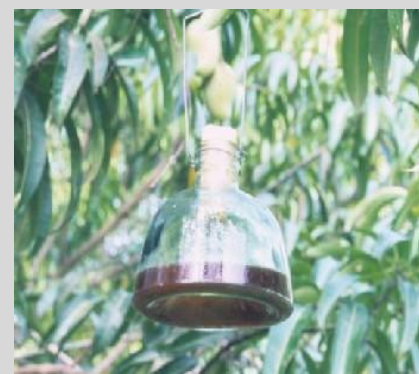
Figure 8. Piège McPhail.

Le piège McPhail (McP) classique est un récipient invaginé en forme de poire, en verre ou plastique transparent. Le piège a une hauteur de 17,2 cm, une largeur de 16,5 cm à la base et il peut contenir jusqu'à 500 ml de solution (Figure 8). Les éléments du piège comprennent un bouchon en caoutchouc ou un couvercle en plastique qui ferme hermétiquement