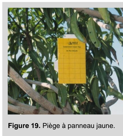
Figure 19. Piège à panneau jaune.