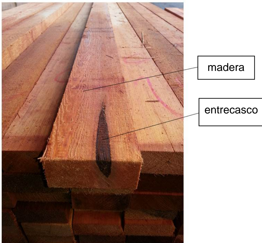
Figura 3. Madera aserrada