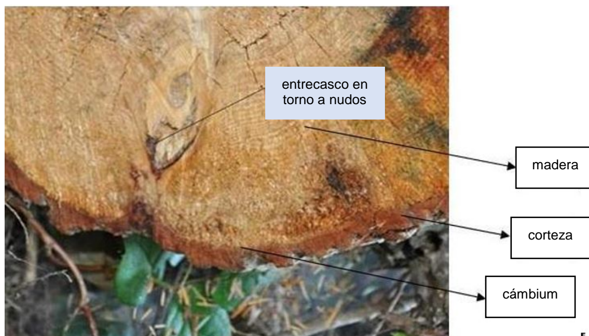
Figura 2. Sección transversal de madera en rollo.