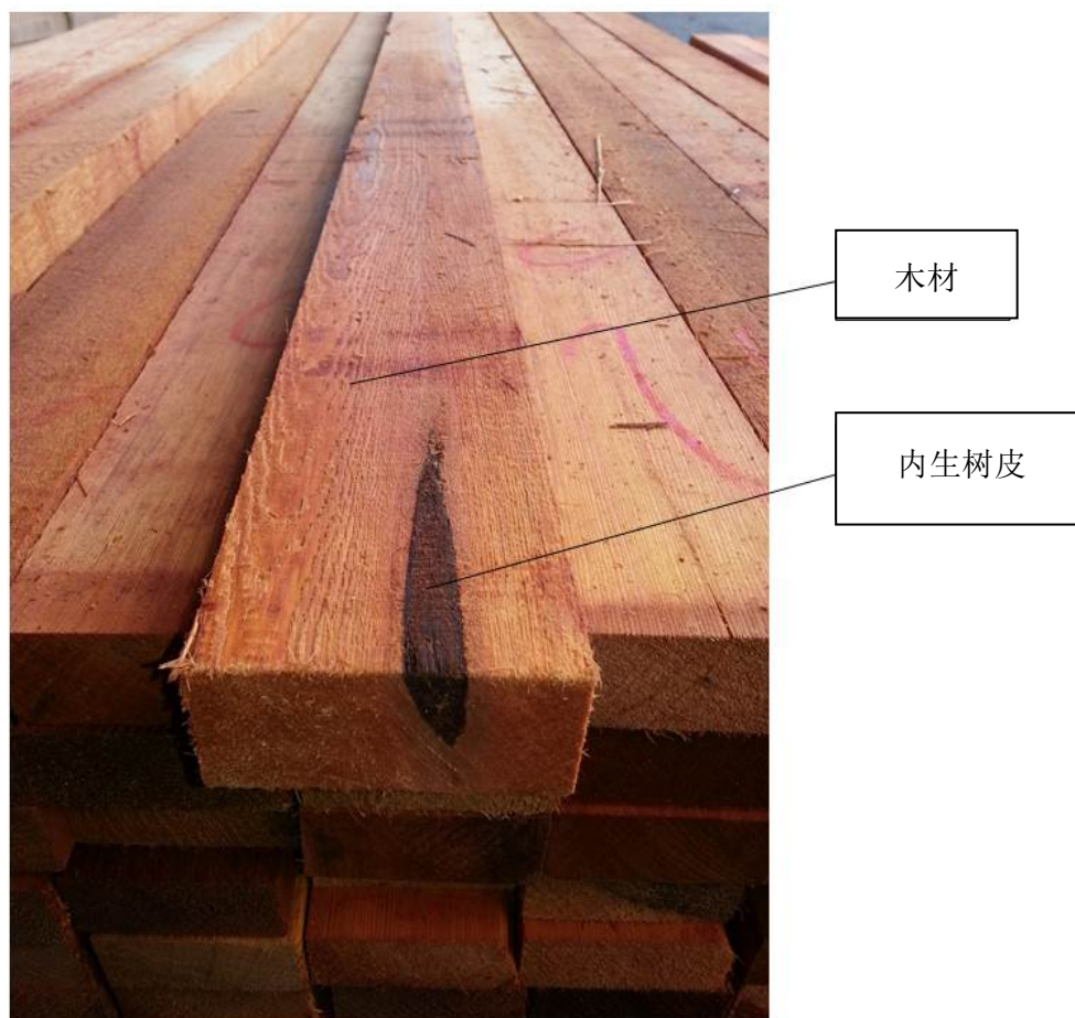
图 3. 锯材