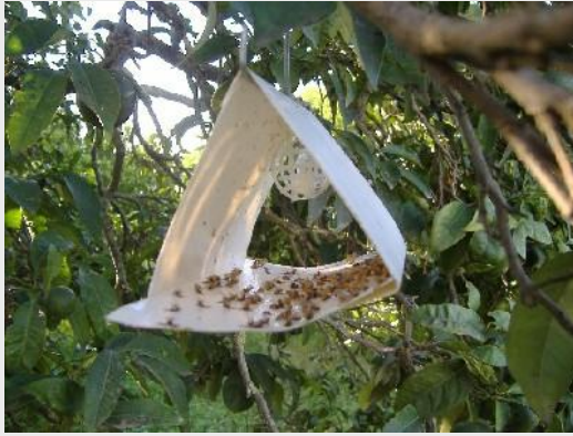
الشكل 5. مصيدة جاكسون أو دلتا