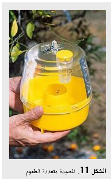
الشكل 11. المصيدة متعددة الطعوم

تتبع هذه المصيدة المبادئ ذاتها لمصائد ماكفيل، على أن جاذب المصيدة متعددة الطعوم المستعمل مع جاذب تركيب جاف أكثر كفاءة وانتخابية من المصيدة متعددة الطعوم أو مصيدة ماكفيل المستعملتين مع جاذب بروتيني سائل. والفارق المهم الآخر هو أن المصيدة متعددة الطعوم مع