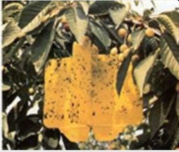
الشكل 20. مصيدة Rebell

تستخدم هذه المصائد كمصائد رؤية بمفردها أو بوضع طعم من التراي ميدلور، سبيروكيتا أو أملاح الأمونيوم (خلات الأمونيوم). يمكن احتواء الجاذبات في موزعات محكمة الإطلاق مثل سداة بوليميرية. تربط الجاذبات إلى وجه المصيدة. كما يمكن خلط الجاذبات مع غطاء الورق المقوّى. ويجعل التصميم ثنائي الأبعاد والسطح الأعمق للاتصال هذه المصائد أكثر كفاءة، فيما يخص مسك الذباب الممارنة مع مصائد جاكسون ومصائد من نمط ماكفيل ومن المهم مراعاة أن هذه المصائد تتطلب إجراءات خاصة للنقل، التوزيع وطرائق غرلة الحشرات كونها