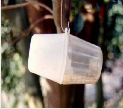
الشكل 17. مصيدة ستاينر