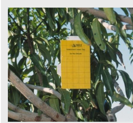
الشكل 19. المصيدة ذات اللوحة الصفراء

تتألف المصيدة ذات اللوحة الصفراء من لوحة صفراء اسطوانية من الورق المقوّى (23×14 سم) مغطاة بالبلاستيك (شكل 19). ويغطي المستطيل من جانبيه بطبقة رقيقة من مادة لاصقة. ومصيدة Rebell هي مصيدة ثلاثية الأبعاد (15×20 سم) من نمط اللوحة الصفراء مصنوعة من البلاستيك (بولي بروبيلين) الذي يجعلها شديدة الديمومة (شكل 20). تغطي المصيدة أيضاً بطبقة رقيقة من مادة لزجة من كلا الجانبين لكلتا اللوحتين. وتستعمل علاقة من السلك، توضع على قمة جسم المصيدة لتعليق المصيدة على أغصان الشجرة.