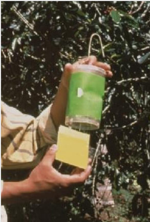
الشكل 12. المصيدة الجافة مفتوحة الأسفل أو مصيدة (الطور الرابع)