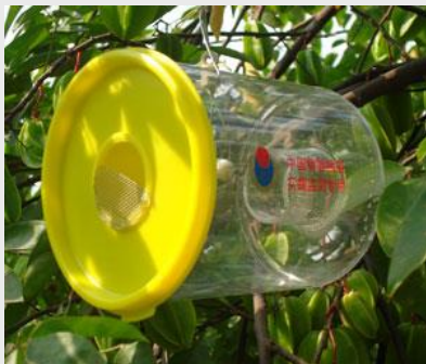
الشكل 16. مصيدة ستاينر

تستخدم هذه المصيدة جاذبات بارافرمونية منخصصة للذكور TML، ME و CUE. ويعلق الجاذب من مركز داخل المصيدة. قد يكون الجاذب فتيلاً قطنياً منقوعاً في 2-3 مل من خليط من البارافرمونات أو موزع مع جاذب ومبيد حشرات (عادة مالاثيون، داي بروم أو ديلتا مثرين) كعامل قتل.