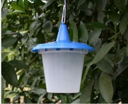
الشكل 14. مصيدة سنسوس

تتألف مصيدة سنسوس من جردل بلاستيكي عامودي ارتفاعه 12.5 سم وقطره 11.5 سم (شكل 14). وتمتلك جسمًا شفافاً وغطاءً أزرق معلق فوقه مزود بثقب في أسفله. ويستعمل سلك معلق يوضع على قمة جسم المصيدة لتعليق المصيدة على أغصان الأشجار.