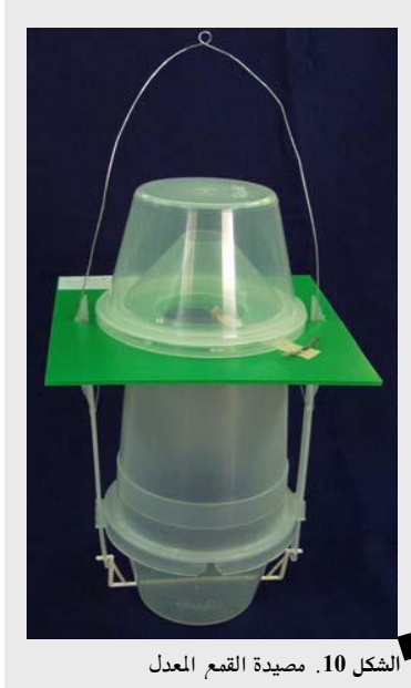
الشكل 10. مصيدة القمع المعدل