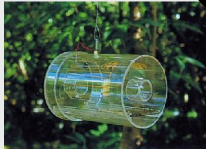
الشكل 15. مصيدة ستاينر التقليدية