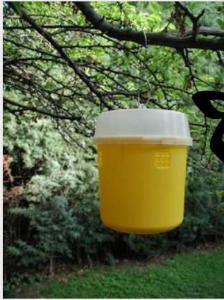
الشكل 18. مصيدة تفري

يوضع في المصيدة طعم من البروتين المماه بتركيز 9٪. على أنه يمكن استعمالها مع جاذبات بروتينية أخرى كما جاء وصفه في مصيدة ماكفيل الزجاجة التقليدية أو مع جاذب غذائي تركيبى جاف للإناث مع TMD في سدادة أو