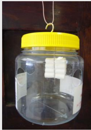
الشكل 6. مصيدة لينفيلد

(5). وتعدّ المصيدة المغربية المتوسطية نسخة أخرى لمصيدة لينفيلد (الشكل 6).