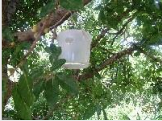
الشكل 7. مصيدة المغرب المتوسطية

تتألف مصيدة لينفيلد التقليدية من مرطبان بلاستيكي يستعمل لمرة واحدة فقط، بارتفاع 11.5 سم، وقطر 10 سم عند القاعدة و 9 سم عند القمة الحلزونية للغطاء. يوجد في جسم المرطبان البلاستيكي أربعة ثقبوب دخول موزعة بتجانس حول جدران المصيدة (الشكل