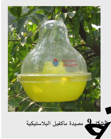
الشكل 9 مصيدة ماكفيل البلاستيكية

كي تعمل المصيدة بشكل مناسب، من الضروري أن يبقى جسم المصيدة نظيفاً. ولبعض التصاميم جزأين يمكن فيها فصل الجزء العلوي عن قاعدة المصيدة للسماح بخدمة أيسر (إعادة وضع الطعم) وتفتيش المسوكات من ذباب ثمار الفاكهة.