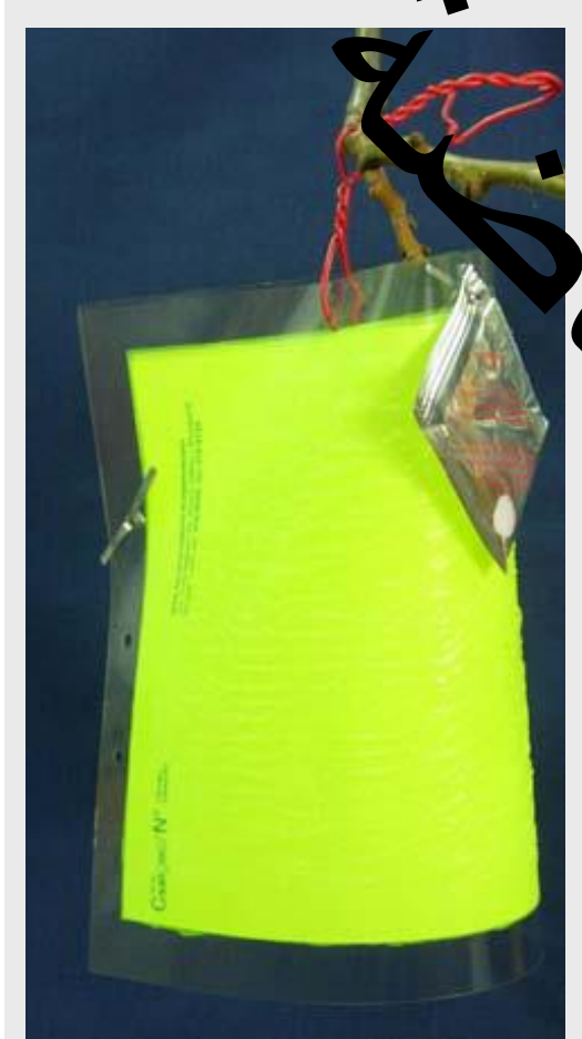
الشكل 4 المصيدة الصفراء اللاصقة المومضة