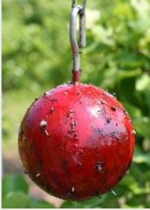
شكل 13. مصيصة الكرة الحمراء

المصيصة هي كرة حمراء قطرها 8 سم (شكل 13). تحاكي المصيصة حجم وشكل تفاحة ناضجة. كما قد تستخدم أيضاً نسخة من المصيصة بلون أخضر. تغطّي المصيصة بمادة لاصقة وتطعم بمادة هكسانوات البوتيل التي تمتلك رائحة تشبه رائحة الثمرة الناضجة. ويتصل مع قمة الكرة علاقة من السلك تستخدم لتعليق الكرة على أغصان الشجرة.