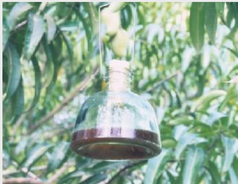
الشكل 8. مصيدة ماكفيل

تتألف مصيدة ماكفيل التقليدية (MCP) من وعاءٍ محتوي على شكل كأس زجاجي أو بلاستيكي شفاف، إحصائي الشكل، يبلغ ارتفاع المصيدة 17.2 سم وعرضها 16.5 سم عند القاعدة وتتسع لـ 500 مل من المحلول (شكل 8) وتضم أجزاء المصيدة سداً مطاطية أو غطاء بلاستيكي يُغلق الجزء العلوي من المصيدة وخطافاً من السلك لتعليق المصائد على أفرع الشجرة. توجد نسخة بلاستيكية من مصيدة ماكفيل بارتفاع 18 سم وعرض 16 سم عند القاعدة وتتسع لـ 500 مل من المحلول (شكل 9). يكون الجزء القمي شفافاً والقاعدي أصفر اللون.