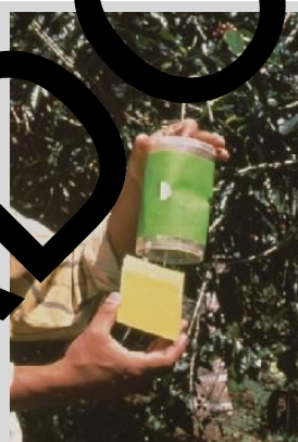
Figura 12. Trampa seca de fondo abierto (Fase IV).

Ésta es una trampa de fondo abierto, cilíndrica, seca, que puede estar hecha de plástico opaco de color verde o de cartón encerado color verde. El cilindro mide 15,2 cm de alto y 9 cm de diámetro en su parte superior y 10 cm de diámetro en su parte inferior (Figura 12). Su parte superior es transparente y tiene tres agujeros (cada uno de 2,5 cm de diámetro) espaciados uniformemente alrededor de la circunferencia del cilindro, a medio camino entre los dos extremos, y un fondo abierto, y se utiliza con un inserto pegajoso. Un gancho de alambre, colocado en la parte superior del cuerpo de la trampa, se utiliza para colgarla de las ramas de los árboles.