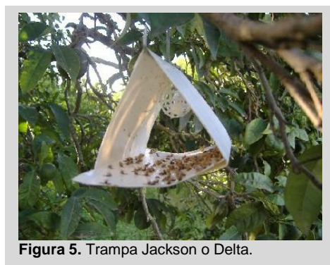
Figura 5. Trampa Jackson o Delta.

La trampa Jackson es blanca y en forma de delta, fabricada de cartón encerado color blanco. Mide 8 cm de alto, 12,5 cm de largo y 7 cm de ancho (Figura 5). Las partes adicionales incluyen un inserto rectangular color blanco o amarillo de cartón encerado cubierto por una capa delgada de adhesivo que se utiliza para capturar moscas de la fruta cuando estas se posan dentro del cuerpo de la trampa; una cápsula de polímero o mecha de algodón dentro de una canasta plástica o contenedor de alambre; y un gancho de alambre colocado en la parte superior del cuerpo de la trampa.