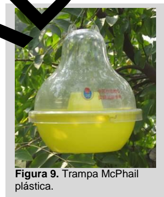
Figura 9. Trampa McPhail plástica.

Para colocar tabletas de levadura como cebo, mezcle tres y cinco tabletas de torula en 500 ml de agua, o siga las indicaciones del fabricante. Revuelva para disolver las tabletas. Para utilizar proteína hidrolizada como cebo, mezcle la proteína hidrolizada y el bórax (si no se ha añadido ya a la proteína) en agua hasta llegar a una concentración de 5 a 9% de proteína hidrolizada y 3% de bórax.