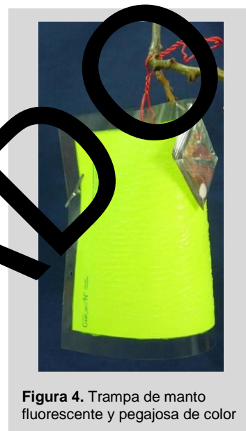
Figura 4. Trampa de manto fluorescente y pegajosa de color

La trampa utiliza la combinación óptima de atrayentes visuales (amarillo fluorescente) y químicos (cebo sintético para moscas de la fruta de la cereza). La trampa se mantiene fija con un pedazo de alambre, sujetado a la rama o poste. El dispensador del cebo se sujeta al borde superior en la parte del frente de la trampa, con el cebo colgado en frente de la superficie pegajosa. La superficie pegajosa de la trampa tiene una capacidad de captura de aproximadamente 500 a 600 moscas de la fruta. Los insectos atraídos por la combinación combinada de estos dos estímulos se adhieren a la superficie pegajosa.