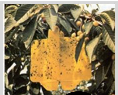
Figura 20. Trampa visual.

Estas trampas pueden utilizarse como trampas visuales por sí solas y cebadas con TML, spiroketal o sales de amonio (acetato de amonio). Los atrayentes podrán colocarse en dispensadores de liberación controlada, tal como una cápsula polimérica. Los atrayentes se colocan en la parte de enfrente de la trampa. Los atrayentes también pueden mezclarse con el recubrimiento del cartón. Su diseño bidimensional y la mayor superficie de contacto hacen que estas trampas sean más eficaces, en términos de capturas de moscas, que las trampas de tipo JT y McPhail. Es importante considerar que estas trampas requieren procedimientos especiales de transporte, entrega, y métodos