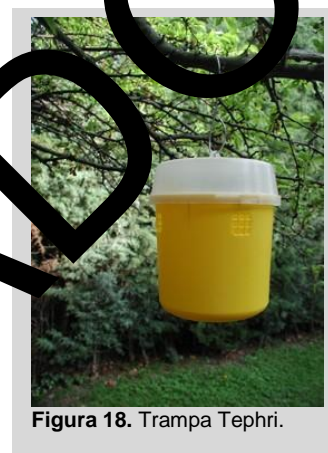
Figura 18. Trampa Tephri.

Esta trampa se ceba con proteína hidrolizada a una concentración del 9%; sin embargo, también puede emplearse con otros atrayentes de proteína líquida, como los descritos para la trampa McPhail convencional de vidrio o con el atrayente alimenticio sintético seco para hembras y con TML en una cápsula o en forma líquida como se describió para las trampas JT/Delta y de panel amarillo. Si la trampa se usa con atrayentes de proteína líquida o con atrayentes sintéticos secos combinados con un sistema de retención de líquido y sin los agujeros laterales, no será necesario el uso de insecticida. Sin embargo, cuando se usa como trampa seca con los agujeros laterales, es necesario utilizar un algodón impregnado con una solución de insecticida (por ejemplo, malation) u otro agente letal para evitar el escape de los insectos capturados. Otros insecticidas adecuados son las grasas de diclorvos o deltametrina (DM) colocadas dentro de la trampa para matar a las moscas de la fruta. El DM se aplica en una capa de polietileno que se coloca sobre la plataforma plástica dentro de la parte superior de la trampa. Alternativamente, se podrá utilizar DM en un círculo de malla mosquitera impregnada y el efecto letal durará por lo menos seis meses en condiciones de campo. La malla se debe fijar al techo interno de la trampa con algún material adhesivo.