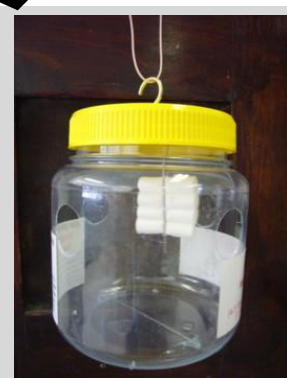
Figura 6. Trampa Lynfield.