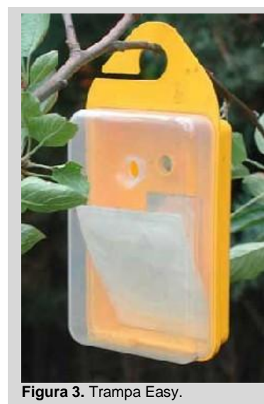
Figura 3. Trampa Easy.

La trampa es para múltiples objetivos. Puede utilizarse seca con cebo de paraferomonas (por ejemplo, TML, CUE, ME) o atrayentes sintéticos alimenticios (por ejemplo, atrayente 3C y ambas combinaciones del atrayente 2C) y con un sistema de retención tal como dichlorvos. También puede utilizarse con cebo húmedo con atrayentes de proteínas líquidas y pueden contener hasta 400 ml de mezcla. Cuando se utilizan atrayentes sintéticos alimenticios, uno de los dispensadores (el que contiene putrescina) se coloca dentro de la parte amarilla de la trampa y los demás dispensadores se dejan vacíos.