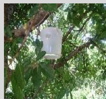
Figure 7. Trampa Maghreb-Med o Marruecos.