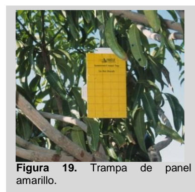
Figura 19. Trampa de panel amarillo.

La trampa de panel amarillo (YP) consiste en una lámina rectangular de color amarillo (23 cm x 14 cm) recubierta de plástico (Figura 19). El rectángulo está cubierto por ambos lados con una capa delgada de material pegajoso. La trampa Rebell es una trampa tridimensional de tipo YP con dos láminas rectangulares de color amarillo cruzadas (15 cm x 20 cm) elaboradas de plástico (polipropileno), por lo cual es extremadamente durable (Figura 20). La trampa también está cubierta con una capa delgada de material pegajoso en ambos lados de ambas láminas. Un gancho de alambre, colocado en la parte superior del cuerpo de la trampa, se utiliza para colgarla de las ramas de los árboles.