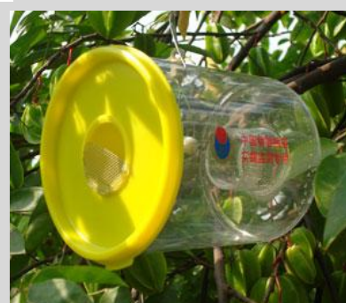
Figura 16. Trampa Steiner.