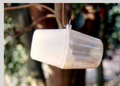
Figura 17. Trampa Steiner.