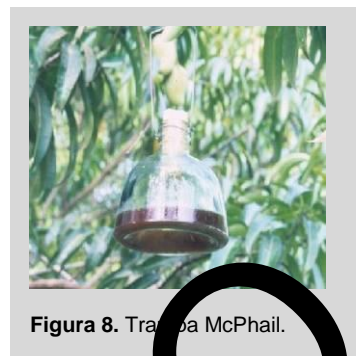
Figura 8. Trampa McPhail.

La trampa McPhail (McP) convencional es un contenedor invaginado en forma de pera, de vidrio o plástico transparente. La trampa mide 17,2 cm de alto y 16,5 cm de ancho en la base y puede contener hasta 500 ml de solución (Figura 8). La trampa consta, además, de un tapón de corcho o tapa de plástico que sella la parte superior de la trampa y de un gancho de alambre para colgar la trampa de las ramas de los árboles. La versión plástica de la trampa McPhail mide 18 cm de alto y 16 cm de ancho en su base y puede contener hasta 500 ml de solución (Figura 9). La parte superior es transparente y la base es amarilla.