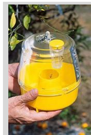
Figura 11. Trampa Multilure.