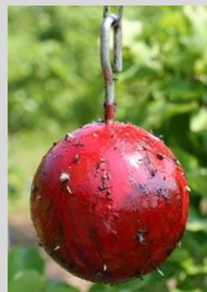
Figura 13. Trampa de esfera roja.

La trampa de esfera roja o verde puede utilizarse sin cebo, pero es más eficiente para la captura de moscas de la fruta cuando se usa con cebo. Esta trampa atrae a las moscas de la fruta sexualmente maduras y listas para ovipositar.