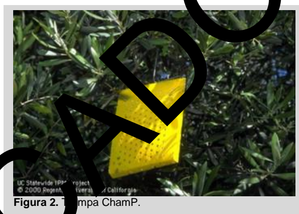
Figura 2. Trampa ChamP.

La trampa ChamP es una trampa hueca de tipo panel amarillo con dos paneles laterales perforados y pegajosos. Cuando se doblan ambos paneles, la trampa adquiere una forma rectangular (18 cm × 15 cm), y se crea una cámara central para colocar el atrayente (Figura 2). Un gancho de alambre ubicado en la parte superior de la trampa se utiliza para colocarla en las ramas.