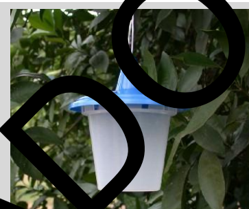
Figura 14. Trampa Sensus.