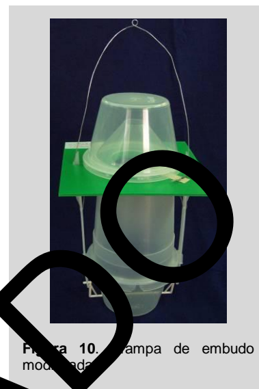
Figura 10. Trampa de embudo modificada.

Cuando la MLT se utiliza como trampa húmeda, se debería añadir un surfactante al agua. En climas cálidos, puede utilizarse 10% de propileno glicol para disminuir la evaporación del agua y la descomposición de las moscas de la fruta capturadas.