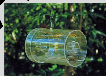
Figura 15. Trampa Steiner convencional.