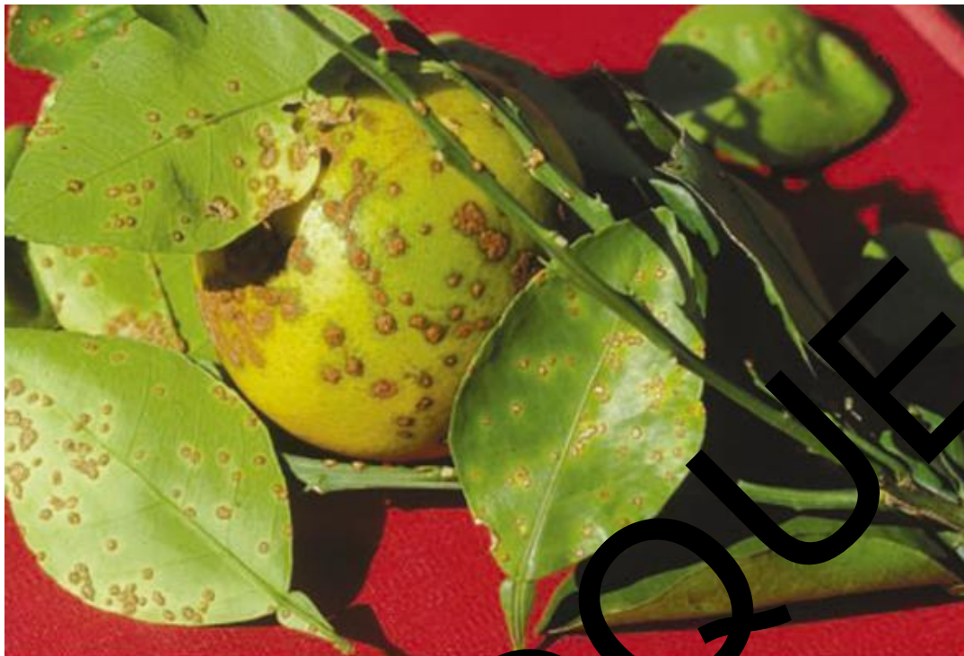
Figure 1. Symptômes caractéristiques du chancre bactérien des agrumes sur des feuilles, des rameaux et un fruit de pomelo ( Citrus paradisi ).