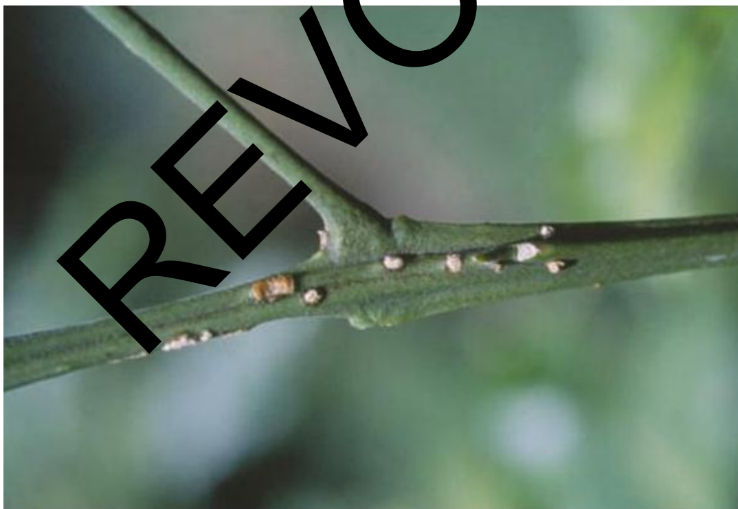
Figure 2. Symptômes du chancre bactérien des agrumes sur un rameau: lésions récentes sur pomelo ( Citrus paradisi ).