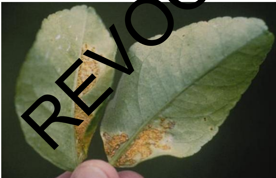
Figure 4. Symptômes du chancre bactérien des agrumes sur des feuilles de citronnier ( Citrus limon ), exacerbés par des blessures dues à la mineuse des agrumes.