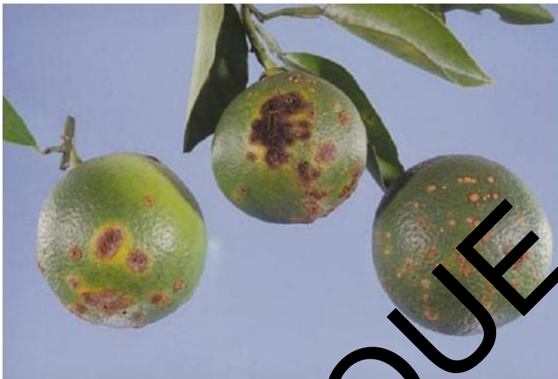
Figure 3. Symptômes du chancre bactérien des agrumes sur des fruits: orange douce ( Citrus sinensis ) (à gauche) et pomelo ( Citrus paradisi ) (au centre et à droite).