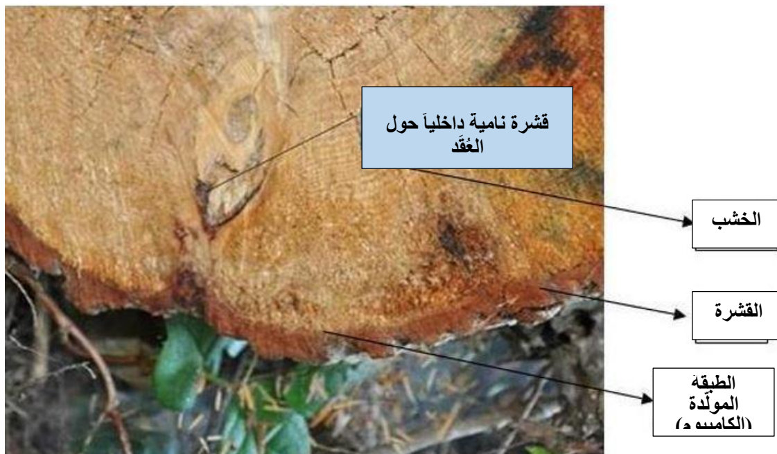
الشكل 2- مقطع مستعرض لخشب مستدير