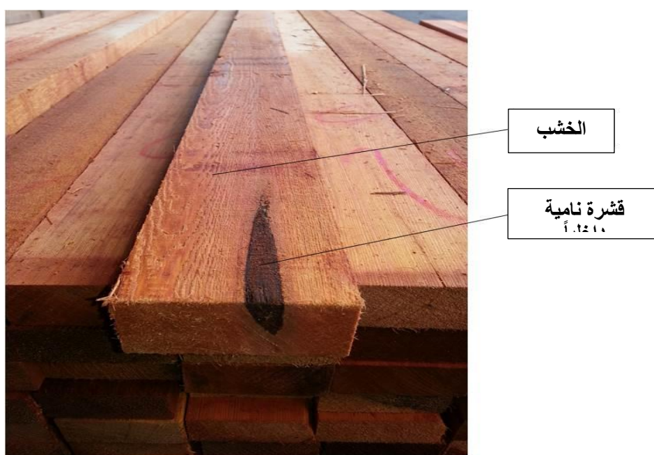
الشكل 3- خشب منشور.