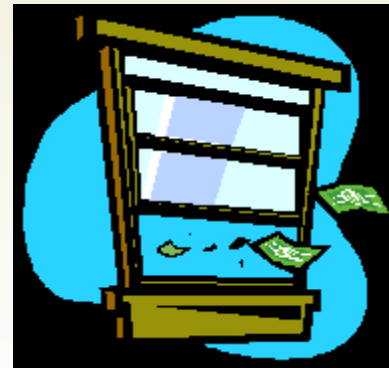
Certificados de Calidad