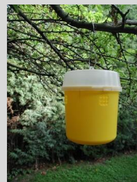
Figura 18. Trampa Tephri.