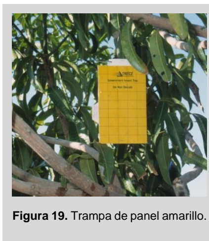
Figura 19. Trampa de panel amarillo.