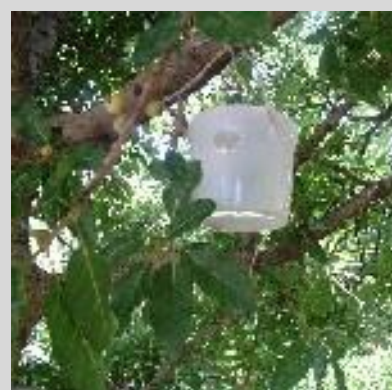
Figura 7. Trampa Maghreb-Med o Marruecos.