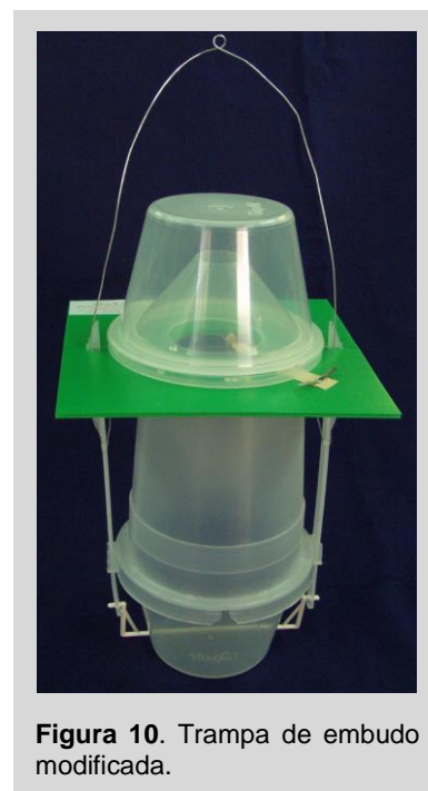
Figura 10. Trampa de embudo modificada.