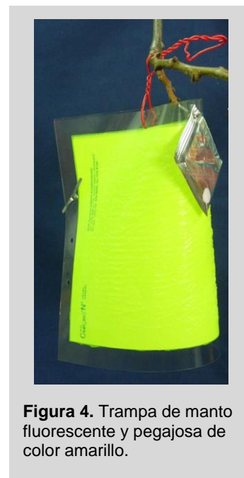
Figura 4. Trampa de manto fluorescente y pegajosa de color amarillo.