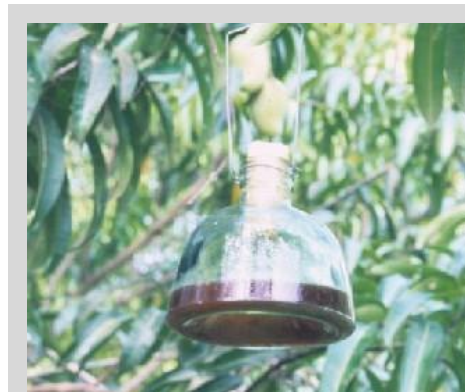
Figura 8. Trampa McPhail.

La trampa McPhail (McP) convencional es un contenedor invaginado en forma de pera, de vidrio o plástico transparente. La trampa mide 17,2 cm de alto y 16,5 cm de ancho en la base y puede contener hasta 500 ml de solución (Figura 8). La trampa consta, además, de un tapón de corcho o tapa de plástico que sella la parte superior de la trampa y de un gancho de alambre para colgar la trampa de las ramas de los árboles. La versión plástica de la McP mide 18 cm de alto y 16 cm de ancho en su base y puede contener hasta 500 ml de solución (Figura 9). La parte superior es transparente y la base es amarilla.