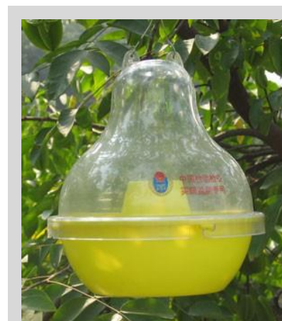
Figura 9. Trampa McPhail plástica.

Las trampas McP se utilizan en programas de manejo de moscas de la fruta en combinación con otras trampas. En áreas sometidas a acciones de supresión y erradicación, estas trampas se utilizan principalmente para monitorear poblaciones de hembras. Las capturas de hembras son cruciales para evaluar la cantidad de esterilidad inducida en una población silvestre mediante un programa de técnica de insecto estéril (TIE). En los programas que liberan sólo machos estériles o en un programa de técnica de aniquilación de machos, las trampas McP se utilizan como herramienta de detección de poblaciones mediante la captura de hembras silvestres, mientras que otras trampas (por ejemplo, las JT) cebadas con atrayentes específicos para machos, atrapan los machos estériles liberados, y su uso debería limitarse a programas con un componente de TIE. Además, en áreas libres de moscas de la fruta, las trampas McP son parte importante de la red de trampeo de moscas de la fruta no nativas debido a su capacidad de capturar especies de moscas de la fruta de importancia cuarentenaria para las cuales no existen atrayentes específicos.