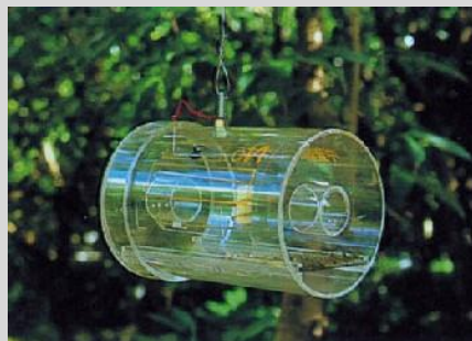
Figura 15. Trampa Steiner convencional.

Esta trampa se ceba con proteína hidrolizada a una concentración del 9%; sin embargo, también puede emplearse con otros atrayentes de proteína líquida, como los descritos para la trampa McPhail convencional de vidrio o con el atrayente alimenticio sintético seco para hembras y con TML en una cápsula o en forma líquida como se describió para la trampa JT o Delta y la trampa de panel amarillo. Si la trampa se usa con atrayentes de proteína líquida o con atrayentes sintéticos secos combinados con un sistema de retención de líquido y sin los agujeros laterales, no será necesario el uso de insecticida. Sin embargo, cuando se usa como trampa seca con los agujeros laterales, es necesario utilizar un algodón impregnado con una solución de insecticida (por ejemplo, malation) u otro agente letal para evitar el