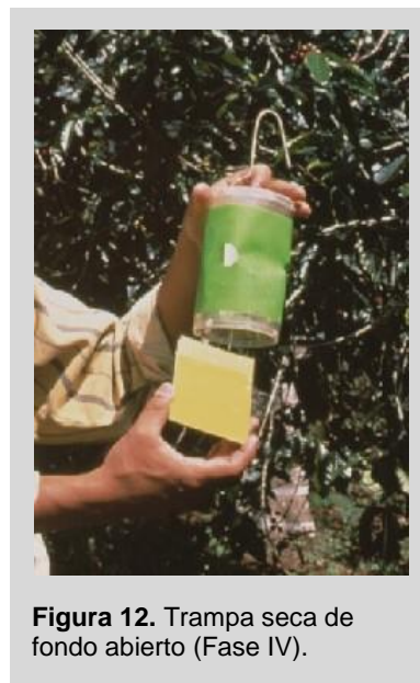
Figura 12. Trampa seca de fondo abierto (Fase IV).