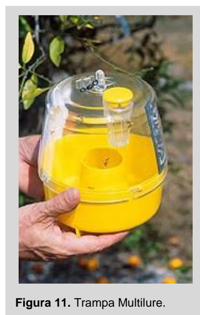
Figura 11. Trampa Multilure.

Esta trampa sigue los mismos principios de la trampa McP. Sin embargo, la MLT utilizada con un atrayente sintético seco es más eficaz y selectiva que las trampas MLT o McP usadas con un atrayente de proteína líquida. Otra diferencia importante es que una MLT empleada con atrayente sintético seco permite una revisión más limpia y requiere de mucha menos mano de obra