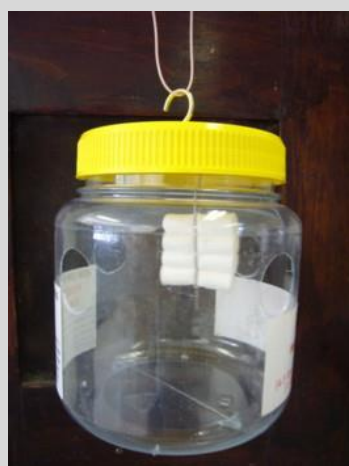
Figura 6. Trampa Lynfield.

La trampa Lynfield (LT) convencional consiste de un contenedor de forma cilíndrica, desechable, de plástico claro, que mide 11,5 cm de alto con una base de 10 cm de diámetro y una tapa de rosca de 9 cm de diámetro. Tiene cuatro agujeros de entrada espaciados uniformemente alrededor de la pared de la trampa (Figura 6). La trampa Maghreb-Med, también conocida como trampa Marruecos, es otra versión de la LT (Figura 7).