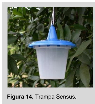
Figura 14. Trampa Sensus.