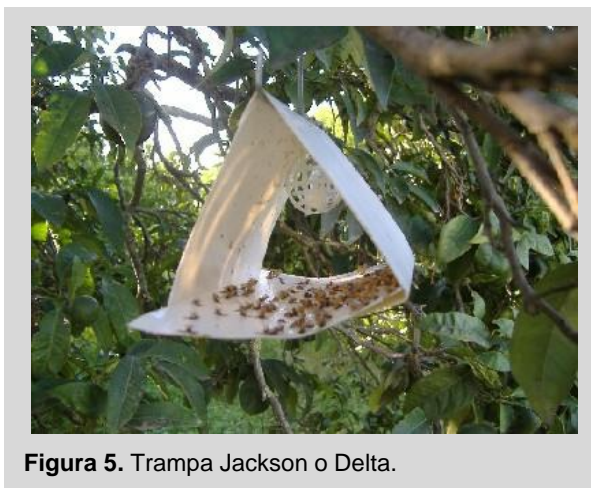
Figura 5. Trampa Jackson o Delta.

La trampa Jackson (JT) es hueca y en forma de delta, fabricada de cartón encerado color blanco. Mide 8 cm de alto, 12,5 cm de largo y 9 cm de ancho (Figura 5). Las partes adicionales incluyen un inserto rectangular color blanco o amarillo de cartón encerado, cubierto por una capa delgada de adhesivo que se utiliza para capturar moscas de la fruta cuando estas se posan dentro del cuerpo de la trampa; una cápsula de polímero o mecha de algodón dentro de una canasta plástica o contenedor de alambre; y un gancho de alambre colocado en la parte superior del cuerpo de la trampa.