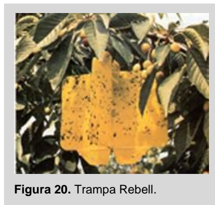
Figura 20. Trampa Rebell.