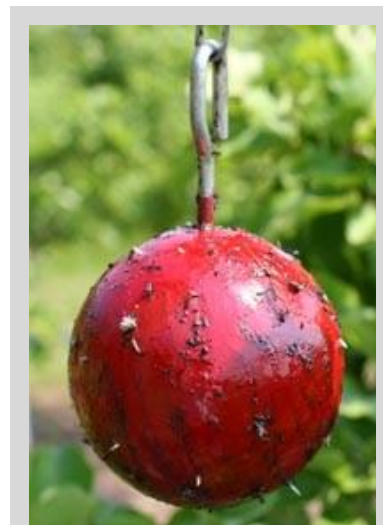
Figura 13. Trampa de esfera roja.