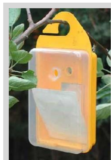
Figura 3. Trampa Easy.

La trampa es para múltiples objetivos. Puede utilizarse seca con cebos para machos (por ejemplo, TML, CUE, ME) o atrayentes sintéticos alimenticios (por ejemplo, atrayente 3C y ambas combinaciones del atrayente 2C) y con un sistema de retención tal como dichlorvos. También puede utilizarse con cebo húmedo con atrayentes de proteínas líquidas y pueden contener hasta 400 ml de mezcla. Cuando se utilizan atrayentes sintéticos alimenticios, uno