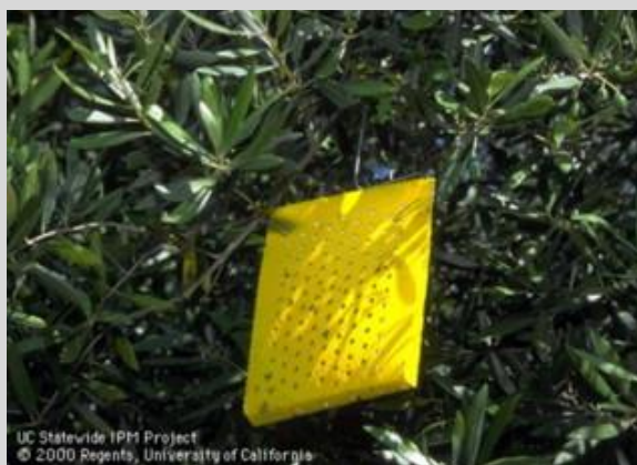
Figura 2. Trampa ChamP.

Con la trampa CH se pueden utilizar parches, paneles poliméricos y cápsulas. Es equivalente a una trampa YP y trampa Rebell en cuanto a sensibilidad.