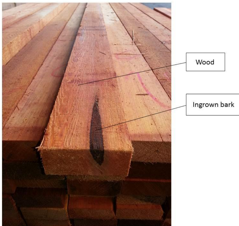
Рисунок 3. Пиломатериалы.