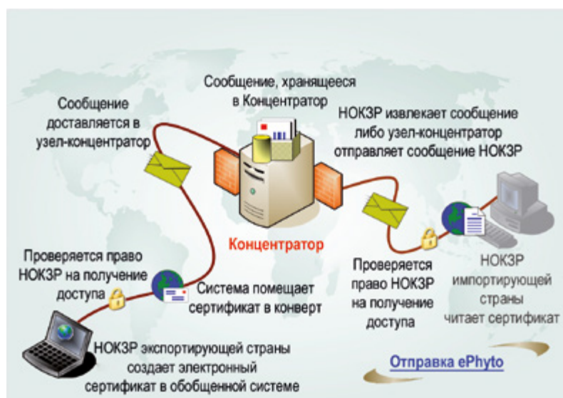
Рисунок Передача ЭФС