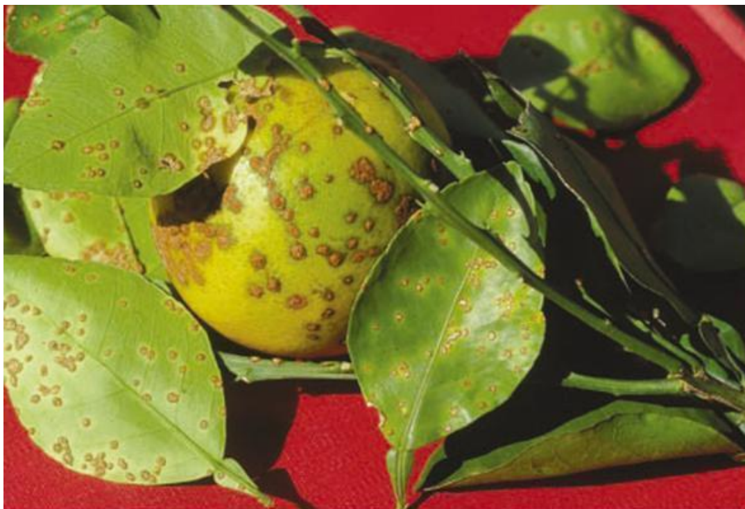
图 1. 柚子 ( Citrus paradisi ) 叶片、枝条和果实上典型的柑橘溃疡病症状。