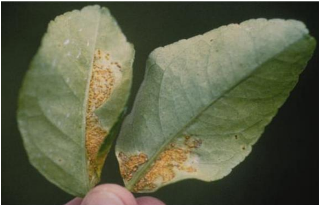
图 4. 柑橘潜叶蛾为害加重后的柠檬 ( Citrus limon ) 叶片上的柑橘溃疡病症状。