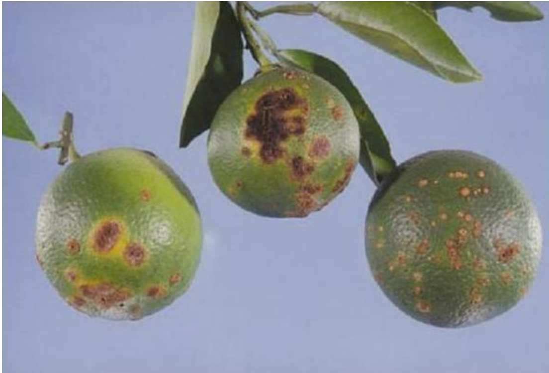
图 3. 甜橙 ( Citrus sinensis ) (左) 和柚子 ( Citrus paradisi ) (中和右) 果实上柑橘溃疡病症状。