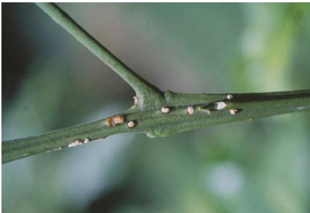
图 2. 柑橘溃疡病在嫩枝上的症状：柚子 ( Citrus paradisi ) 上早期病斑。